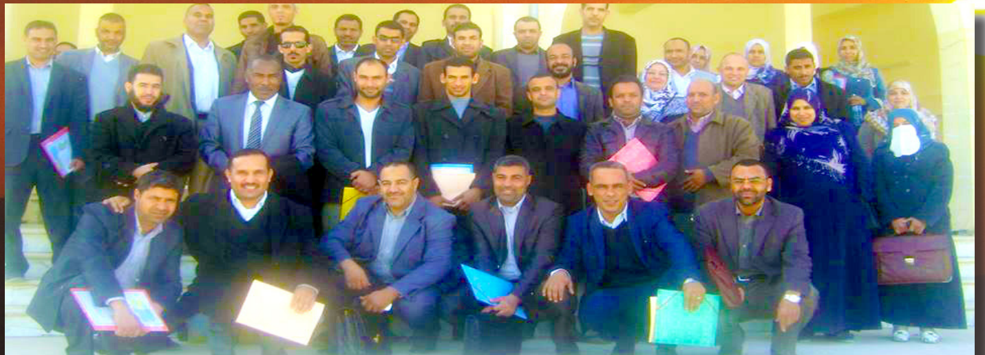
صورة جماعية لأساتذة الكلية بعد نجاح الدورة التدريبية : كلهم على قلب رجل واحد لتطوير الكلية