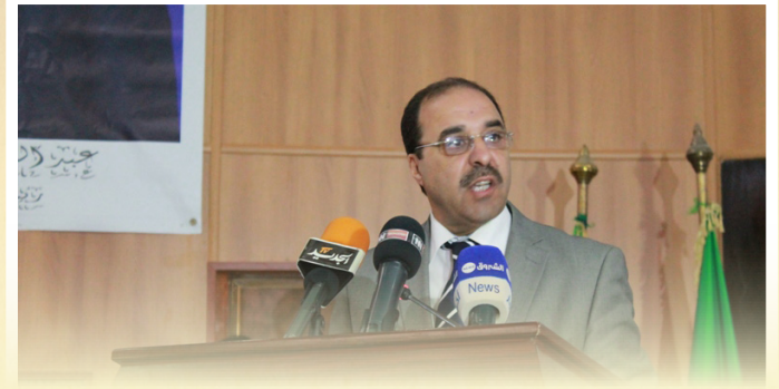
السيد والي ولاية الوادي