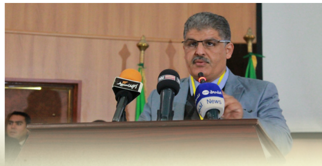
السيد مدير الجامعة

ولاية الوادي والوفد المرافق له، السيد مدير الجامعة والسلطات المحلية والعسكرية والامنية، وممثلي وسائل الاعلام المسموعة والمرئية وأساتذة وطلبة جامعة الشهيد حمه لخضر، كما عرف الملتقى حضورا كبيرا لشخصيات علمية ووطنية و أساتذة باحثين من