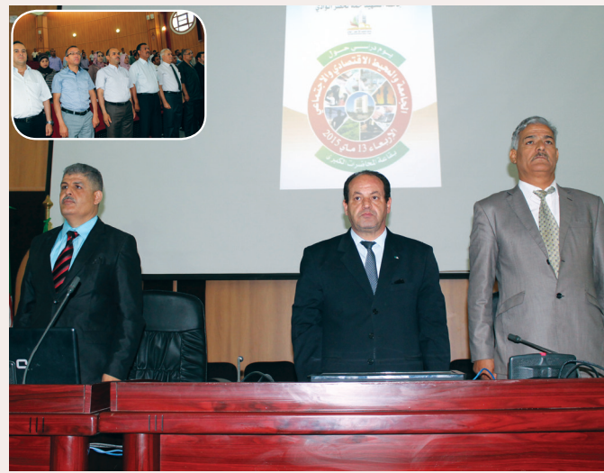
مديرية التكوين المهني