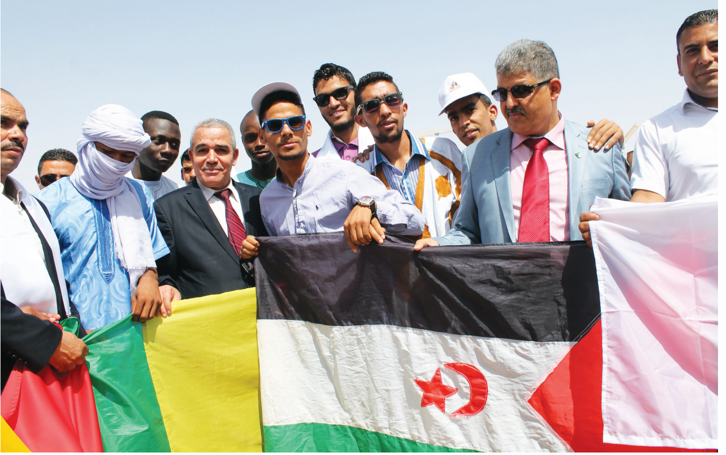
تكريم رئيس المجلس الشعبي الولائي