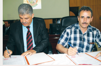
غرفة التجارة والصناعة سوف