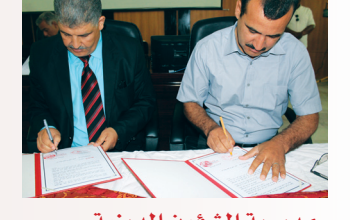
مديرية الشؤون الدينية