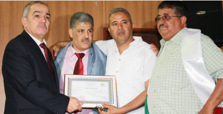
تكريم الفنانين التشكيليين المشاركين في الركن الأخضر