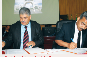
مديرية الشباب والرياضة