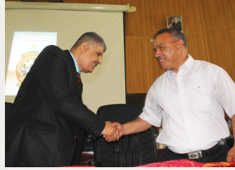
مديرية الصحة والسكان