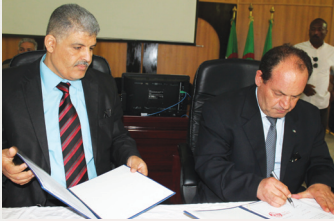
مجمع رزاق بكرة